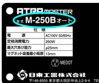
アトラマスター M-250B オート