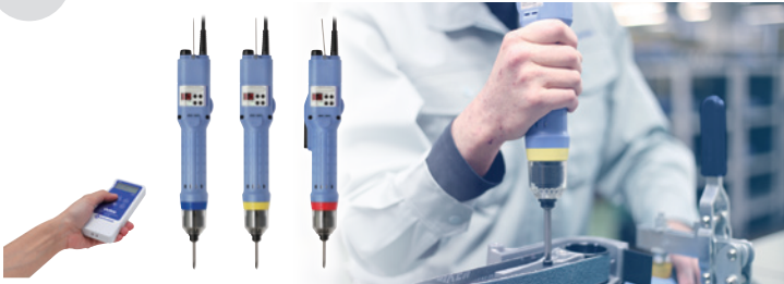
ブラシレスデルボ S シリーズ (速度可変タイプ)