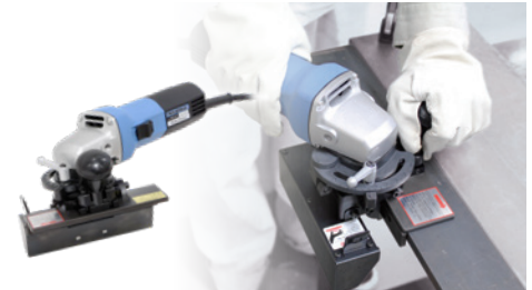
電動ミニベベラー EMB-0307C