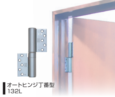
オートヒンジ丁番型 132L