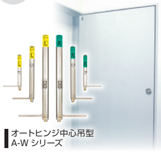
オートヒンジ中心用型 A-W シリーズ