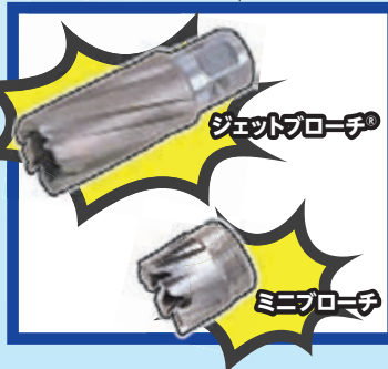
ジェットブローチ®