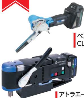
ベルトン® CLB-10 PAT.P D.PAT