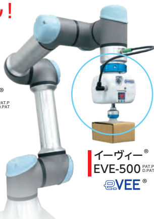
イーヴィー® EVE-500 PAT.P D.PAT eVEE®