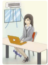
冷房のききすぎで 足腰が冷える 一日中同じ姿勢で 足がむくむ