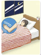
布団に入っても、 足がなかなか温まらず、 寝つけない