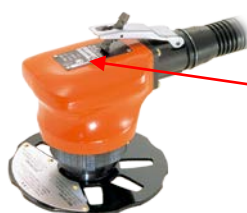
[サーキットベベラー CB-02]