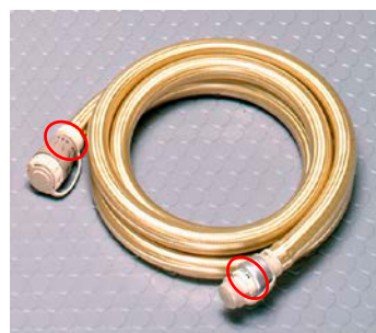
ガスタッチホース