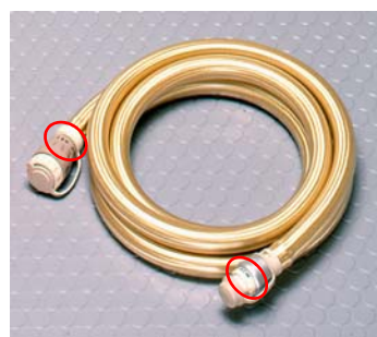
ガスタッチホース